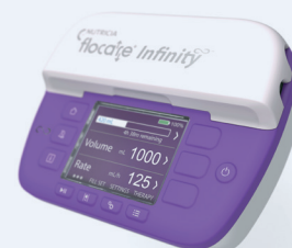
Flocare® Infinity™ III pumpe