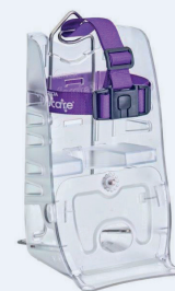
Flocare® Infinity™ Universal frame (stativ) til rygsæk