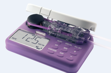
Flocare® Infinity™ pumpe