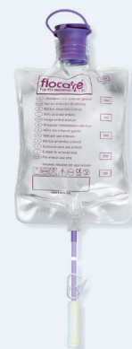
Flocare® Top Fill Reservoir