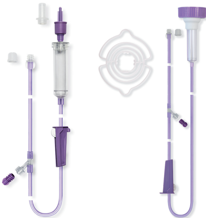
Flocare® Pack set Gravity™

for tilkobling af både Nutricias og andre leverandørers sondeernæring i plastic- og glasflaske.